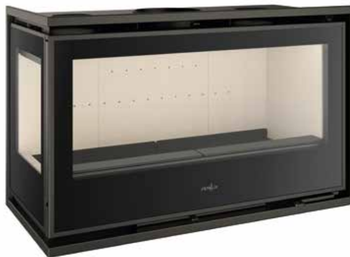
FERLUX | PANORAMIC 90 - 2C

* DISPONIBLE CON CRISTAL EN CARA IZQUIERDA O DERECHA